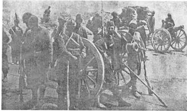
Armeense eenheden die met het Russische leger meevchten om de Turkse stad Van in te nemen (1915)

Vanaf de tweede helft van de 19 e eeuw poogde het tsaristische Rusland het Ottomaanse Rijk te verzwakken en te verdelen en steunde de Armeense separatistische activiteiten en opstanden. Dit leidde tot een verdere radicalisering en militarisering onder nationalistische Armeense groeperingen in gebieden waar de Ottomaanse moslims de meerderheid van de bevolking vormden. Als gevolg hiervan bundelden aanzienlijke groepen Armeniërs hun krachten met het binnenvallende Russische leger om een etnisch homogeen Armeens thuisland te creëren.