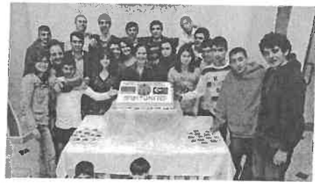
Investeren in de toekomst: Armeens-Turkse Jeugd Basketbal Programma

Maar bij de pogingen om de historische en politieke bitterheid te overwinnen moeten beide partijen eerlijk en open zijn. Het is mogelijk een proces van een waarachtige dialoog waarbij men andermans waarheid leert te respecteren en een geleidelijke opbouw van wederzijds respect door herkenbaarheid en inleving tot stand te brengen. Zouden deze pogingen niet helpen om de Turkse en Armeense verhalen nader te brengen tot een "juiste herinnering"?