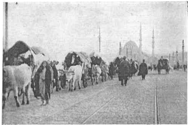
Ottomaanse vluchtelingen uit de Balkan komen Istanbul binnen (1913)

Al vóór de Eerste Wereldoorlog was het Ottomaanse Rijk geleidelijk aan begonnen uit elkaar te vallen als gevolg van de binnendringing van Europees kolonialisme, nationalisme en de bijbehorende oorlogen. De Russische expansie en de nationalistische winden die vanuit het westen naar het Ottomaanse Rijk waaiden, leidden tot de ontbinding van de westelijke provincies van het rijk en leidden onherroepelijk tot de verzwakking van de kwakkelende Ottomaanse staatstructuur.