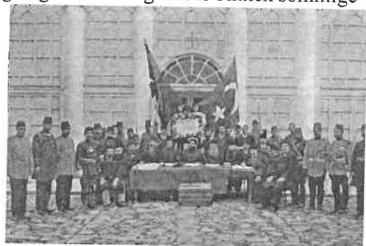
Een afbeelding van de moslim-, Armeense en Griekse volksvertegenwoordigers tijdens de verklaring van de Ottomaanse Grondwet van 1908.

Turken en Armeniërs moeten samenwerken aan de wederopbouw van hun historische vriendschap zonder de moeilijke perioden uit hun geschiedenis te vergeten. Men moet niet vergeten dat, ondanks de gebeurtenissen tijdens de Eerste Wereldoorlog, tot de Armeense aanslagen en PR campagnes vanaf het begin van de jaren zeventig; Armeniërs en Turken goede contacten onderhielden op het sociale vlak en dat dat vandaag de dag nog steeds het geval is binnen sommige emigrantengemeenschappen. Turken en Armeniërs delen een gemeenschappelijk Anatolisch en Ottomaans erfgoed en vele aspecten van hun cultuur, zelfs hun taal. Dit is wellicht de reden dat de radicale Armeense tegenstanders van Turkije tegen elke vorm van contact zijn tussen Armeniërs en Turken, tussen Armenië en Turkije: zij willen mensen afsnijden van dit erfgoed en van wederzijdse aanvaarding en gedeelde cultuur.